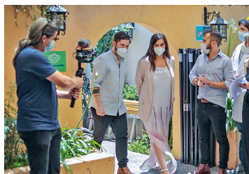
Equipo tributario de Boric apunta a recolectar 5% del PIB durante su gobierno