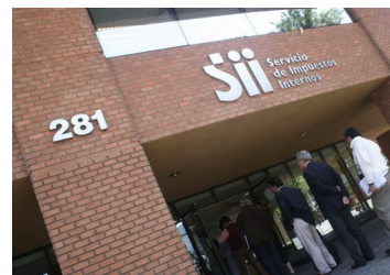
Operación Renta: los cambios que traerán las declaraciones juradas de impuestos para el 2022