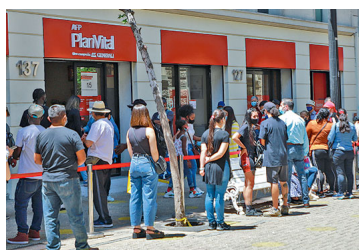
OCDE alerta sobre retiros en el mundo y cree que Chile es donde las pensiones “podrían verse más afectadas”