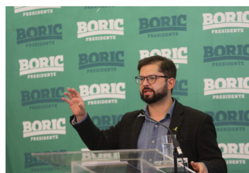
6 claves para leer la propuesta económica de segunda vuelta de Gabriel Boric (+Documento)