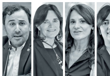
Kast y Boric se aprestan a anunciar cambios al corazón de sus reformas tributarias