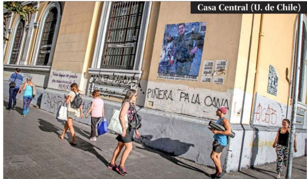
Casa Central (U. de Chile)

RAYADOS. — Ubicada en Diagonal Paraguay, la FEN está a solo algunas cuadras de Plaza Italia. En su exterior se han pegado numerosas ilustraciones y mensajes y también se han rayado vidrios y muros. Al igual que en otros edificios, la consigna antipolicial "A.C.A.B." es una de las más recurrentes.