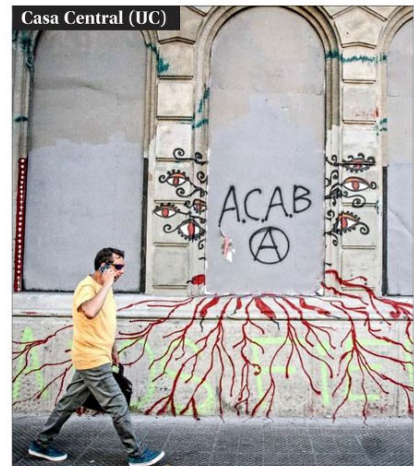
Casa Central (UC)

Chile. Su frontis también tiene múltiples consignas escritas y pegadas, algo que también le ha ocurrido, en menor medida, a la Casa Central del plantel, ubicada en la Alameda cerca de San Diego. A diferencia de la UC, no han sufrido daños como roturas