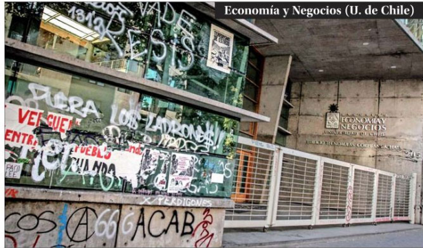
Economía y Negocios (U. de Chile)

RAYADOS. — Ubicada en Diagonal Paraguay, la FEN está a solo algunas cuadras de Plaza Italia. En su exterior se han pegado numerosas ilustraciones y mensajes y también se han rayado vidrios y muros. Al igual que en otros edificios, la consigna antipolicial "A.C.A.B." es una de las más recurrentes.