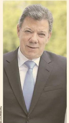
F. Henrique Cardoso Presidente de Brasil 1995-2002.