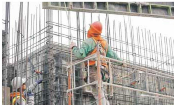
Todos los economistas subrayan en que la menor violencia registrada en diciembre influyó en el resultado del Imacec. La construcción fue uno de los sectores destacados.